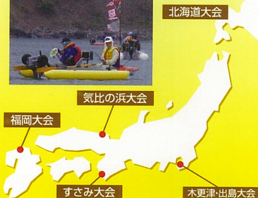
ミニボートフェスティバル2011実施概要