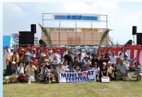
「みなと木更津うみ祭り」のステージ前で表彰式 (昨年大会)

9月19日(月・祝日)「みなと木更津うみ祭り」協賛 マイボートで晩夏の海を一緒に満喫しよう!