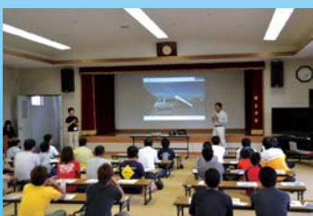
兵庫県気比の浜大会で実施された安全講習会(6月4日)