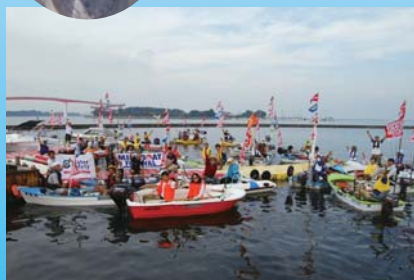
スタート前の記念撮影(昨年大会)