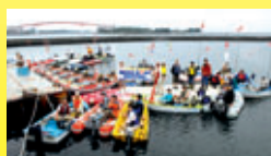
気比の浜大会(終了)