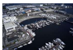
リアル会場全景／フローティング展示は全長10メートルクラスのボートなど66隻が並びました