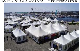
マリンマーケットプレイス