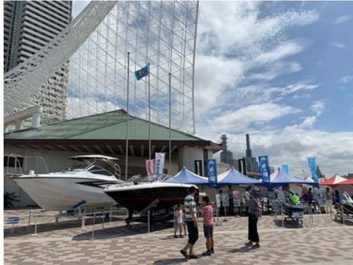
ボート展示（ヤマハ・ヤマハ藤田）