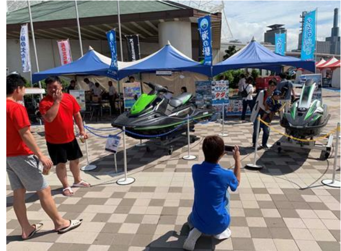
JET展示（カワサキ・ヤマハ）