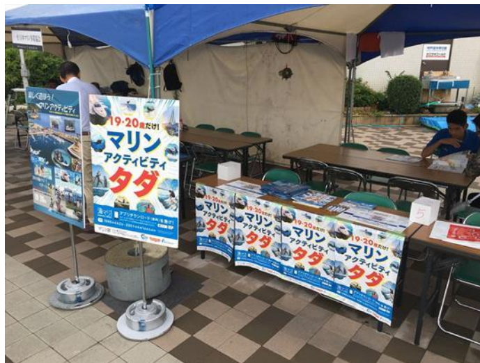
海マジ！ボーティングジャパン告知