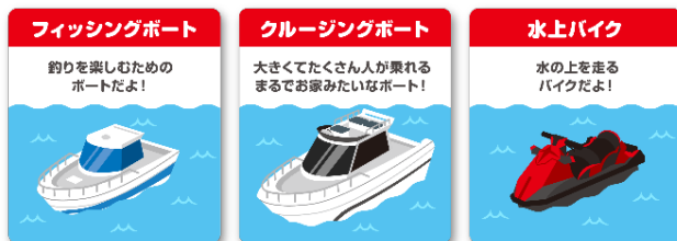
3タイプのボートをコンテンツとして用意

「マリーナ」にまつわる乗り物や建物などをペーパークラフトで作成できるコンテンツです。フィッシングボートやクルージングボート、水上バイクのほか、桟橋や水上コテージなどの建物のコンテンツも豊富に用意しています。