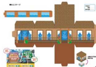
建物は組み立てやすいキューブ型