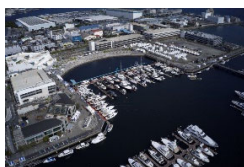
リアル会場全景／フローティング展示は全長10メートルクラスのボートなど66隻が並びました