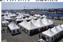
マリンマーケットプレイス